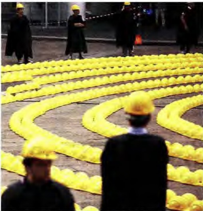
Milano, Piazza Affari: «Giornata della collera» del comparto edilizio