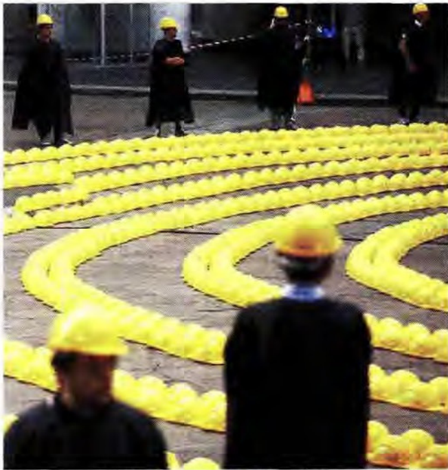
Milano, Piazza Affari: «Giornata della collera» del comparto edilizio