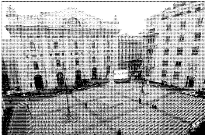
La protesta Ance manifesta la sua rabbia davanti a Piazza Affari

MILANO - "Incontreremo i presidenti delle commissioni anche per far passare i messaggi della nostra visione su tutte le istituzioni, e sono tantissime, che dobbiamo affrontare nei prossimi mesi". Lo ha spiegato il presidente di Confindustria Giorgio Squinzi parlando dell'incontro in programma questa sera con i presidenti di Camera e Senato e delle Commissioni. "Quindi sarà un dialogo. Come sempre la mia è una Confindustria che dialoga, che né urla, né impone. Noi vogliamo dialogare", ha spiegato. "Il nostro difetto più pericoloso è una propensione quasi naturale a conservare lo status quo - ha detto nel suo intervento all'assemblea dell'Unione industriale di Torino - . Aggrapparsi ad un precario presente in attesa del ritorno del passato è un comportamento suicida". Secondo Squinzi, "per essere competitiva l'Italia ha bisogno di un cambio di passo". "Fisco, giustizia, burocrazia, tutto è da riformare e mi fermo qui per carità di patria, una patria a cui vogliamo e vorremo sempre bene nonostante tutto, ma la seconda potenza industriale europea, la settima mondiale, ha bisogno di un cambio di passo e di cultura se non vuole rischiare di essere estro-