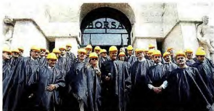
Gli imprenditori edili protestano davanti alla Borsa di Milano

milie, macrogruppi individuati dalle imprese e dai professionisti che quotidianamente le vivono. Dall'edilizia privata all'urbanistica ai lavori pubblici, dall'organizzazione, gestione ed esecuzione dei lavori fino alla fiscalità, finanza, credito ed assicurazioni ogni area sarà ulteriormente arricchita o monitorata al sito www.lagiornatadellacollera.org dove, assicurano gli organizzatori, verrà costantemente aggiornato lo stato della situazione. ■ F. S.