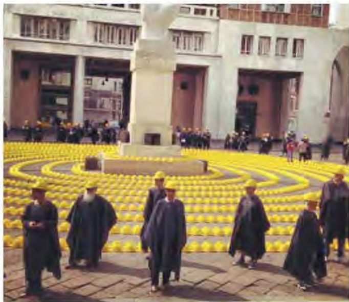
Due momenti della manifestazione dei "caschi gialli" ieri in Piazza Affari a cui hanno partecipato anche Ance Varese e Confindustria Altomilanese