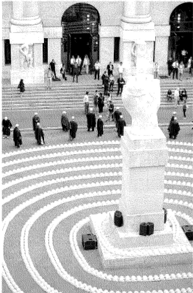
I caschi dei lavoratori dell'edilizia stesi sul selciato della piazza