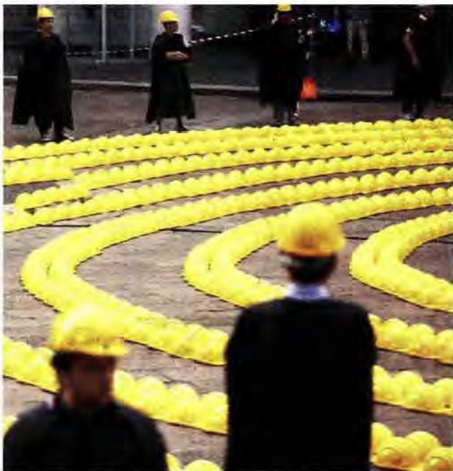
Milano, Piazza Affari: «Giornata della collera» del comparto edilizio